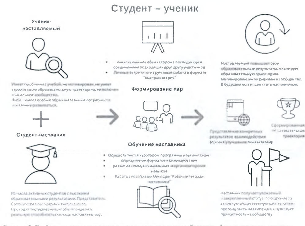
Рис.3. Модель взаимодействия «студент-ученик»

Целью такой формы наставничества является успешное формирование у ученика представлений о следующей ступени образования, улучшение образовательных результатов и мотивации, расширение метакомпетенций, а также появление ресурсов для осознанного выбора будущей личностной, образовательной и профессиональной траекторий развития.