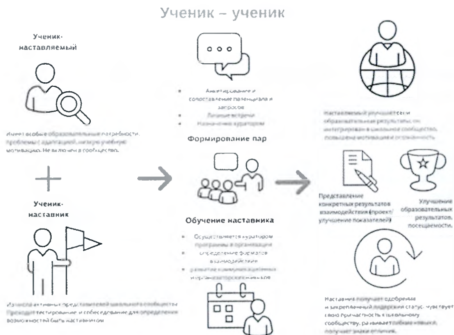
Рис.1. Модель взаимодействия по форме «ученик-ученик»

Предполагает взаимодействие обучающихся одной образовательной организации, при котором один из обучающихся находится на более высокой ступени образования и обладает организаторскими и лидерскими качествами, позволяющими ему оказать весомое влияние на наставляемого, лишнее тем не менее строгой субординации. Вариацией данной формы является форма наставничества «студент – студент».