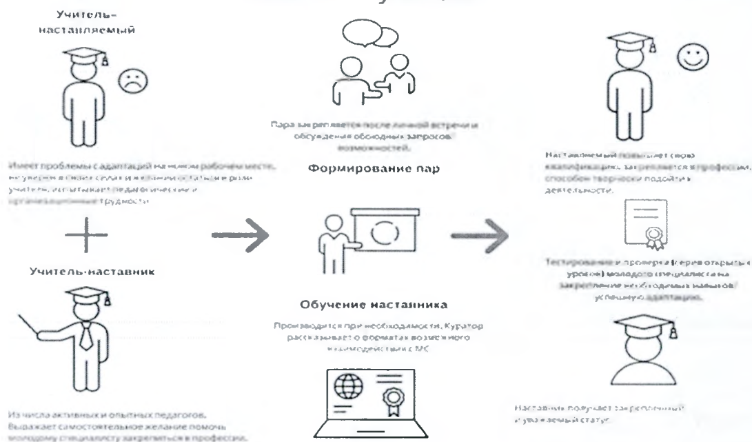
Рис.2. Модель взаимодействия «учитель-ученик»

Целью такой формы наставничества является успешное закрепление на месте работы или в должности педагога молодого специалиста, повышение его профессионального потенциала и уровня, а также создание комфортной профессиональной среды внутри образовательной организации, позволяющей реализовывать актуальные педагогические задачи на высоком уровне. Среди основных задач взаимодействия наставника с наставляемым: способствовать формированию потребности заниматься анализом результатов своей профессиональной деятельности; развивать интерес к методике построения и организации результативного учебного процесса; ориентировать начинающего педагога на творческое использование передового педагогического опыта в своей деятельности; прививать молодому специалисту интерес к педагогической деятельности в целях его закрепления в образовательной организации; ускорить процесс профессионального становления педагога; сформировать сообщество образовательной организации (как часть педагогического).